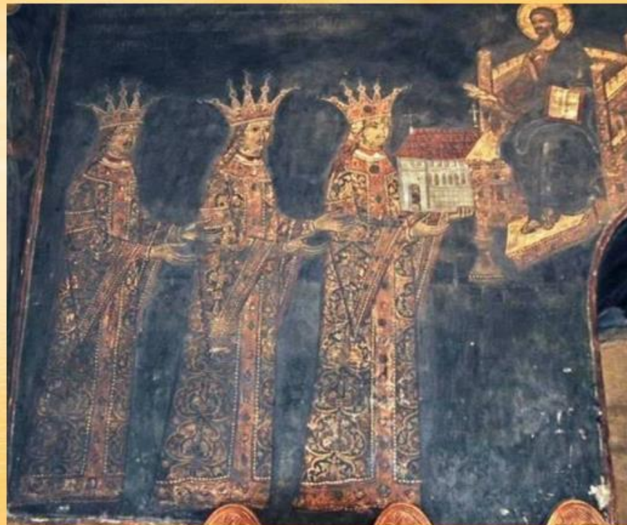
Tabloul votiv îl înfățișează pe Ștefan cel Mare alături de fiii săi Bogdan și Petru Rareș.